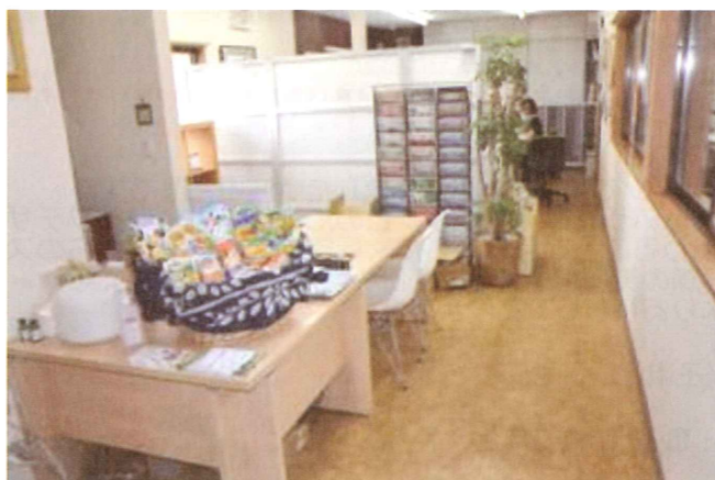
いない倉吉中央店本館入り口より、100m先東側。

らいいでざいんNEWSにて、お店紹介をさせていただきます。約1200世帯へ送付させていただきますので、ご希望の方はどしどしご応募ください!!