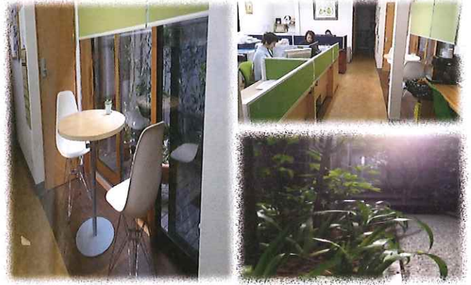
いない倉吉中央店本館入り口より、100m先東側。

すべてはお客様の安心のために 株式会社 ライフデザイン 〒682-0812 鳥取県倉吉市下田中町1026 TEL 0858-27-2500 FAX 0858-27-2501 hoken@apionet.or.jp