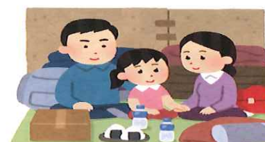
http://utuyoiro.net/794.html tuyoのハテナノートより抜粋

ペットがいる家庭でしたら、わんちゃん・ねこちゃんの数日分のごはんを用意しておくのもよいですね。準備しておく物の中に筆記用具とありますが、できれば油性マジックが望ましいそうです。理由は「自分が立ち寄ったところを他の人に知らせるため」です。家族とはぐれてしまってもメモを残せる・連絡先を記入できるなどメリットがあります。