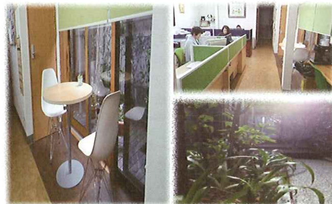
いない倉吉中央店本館入り口より、100m先東側。

引受保険会社 損保ジャパン日本興亜 損保ジャパン日本興亜ひまわり生命 第一生命株式会社 メットライフ生命