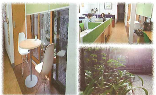
いない倉吉中央店本館入り口より、100m先東側。

引受保険会社 損保ジャパン日本興亜 損保ジャパン日本興亜ひまわり生命 第一生命株式会社 メットライフ生命