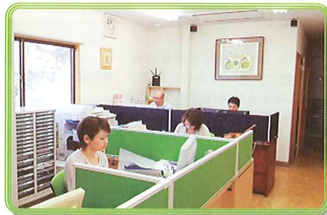
いない倉吉中央店本館入り口より、100m先東側。

◆引受保険会社◆ 損害保険ジャパン NKS Jひまわり生命 第一生命株式会社 メットライフアリコ