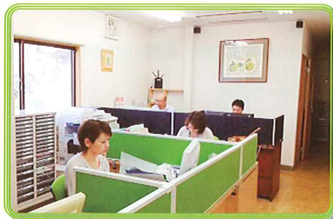
いない倉吉中央店本館入り口より、100m先東側。

◆引受保険会社◆ 損害保険ジャパン NKS Jひまわり生命 第一生命株式会社 メットライフアリコ